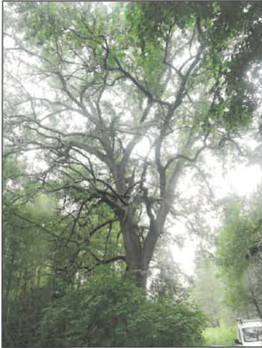
Dąb szypułkowy ( Qercus robur L. )