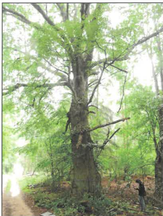
Lipa drobnolistna ( Tilia cordata Mill.)

Orientacyjna lokalizacja drzew proponowanych jako pomniki przyrody