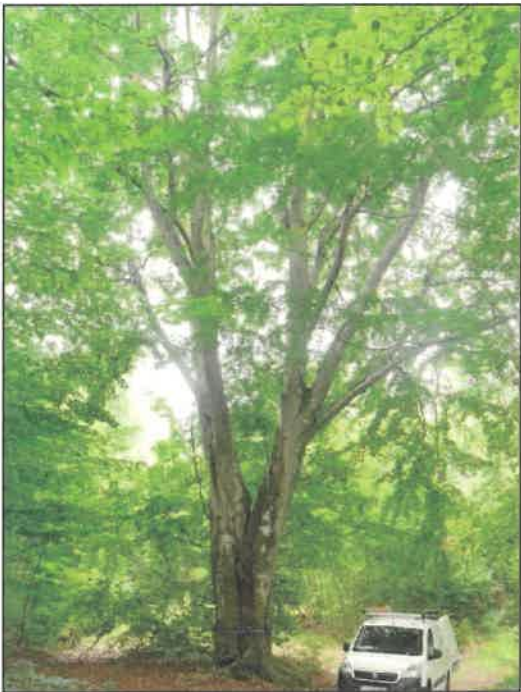
Buk pospolity ( Fagus sylvatica L. )